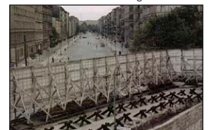
Berlin in den 1960er Jahren