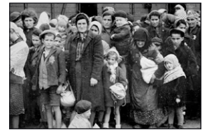
Deportationen ins Vernichtungslager