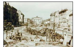
Kriegsende in Berlin