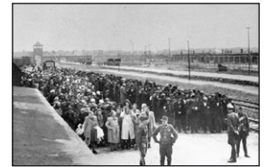
Deportationen ins Vernichtungslager