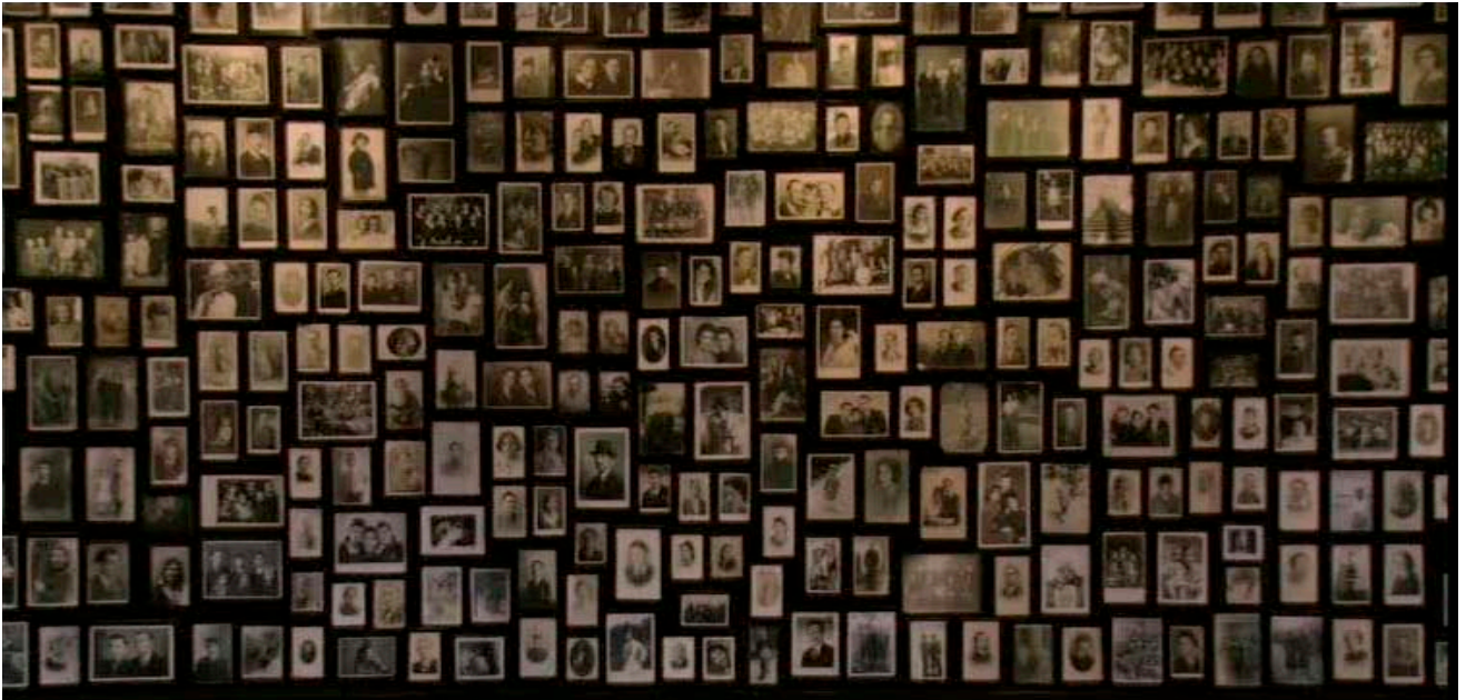
Fotografien von Holocaust-Opfern im Museum in Auschwitz