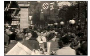
Berlin im Nationalsozialismus